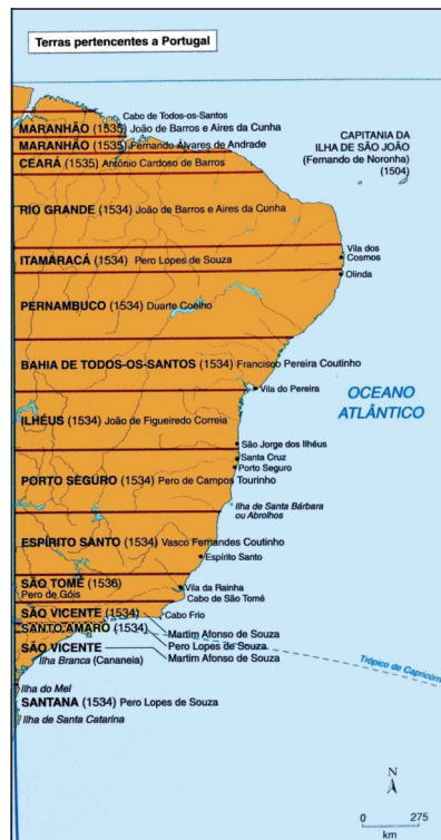
1534 Capitânicas Hereditárias

Acordo entre Portugal e Espanha para dividir terras descobertas e por descobrir fora da Europa.