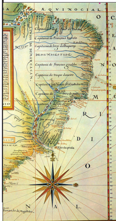
1494 Tratado de Tordesilha

Acordo entre Portugal e Espanha para dividir terras descobertas e por descobrir fora da Europa.