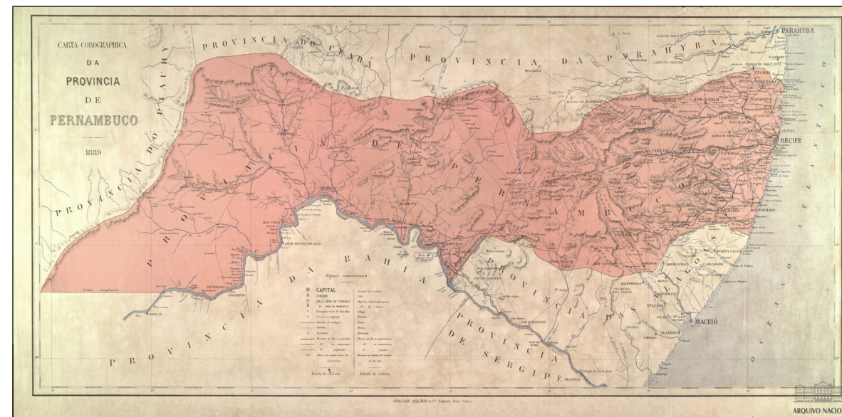
1889 Mapa de Pernambuco

Pernambuco tinha extensão territorial aproximada de 250 mil km 2 .