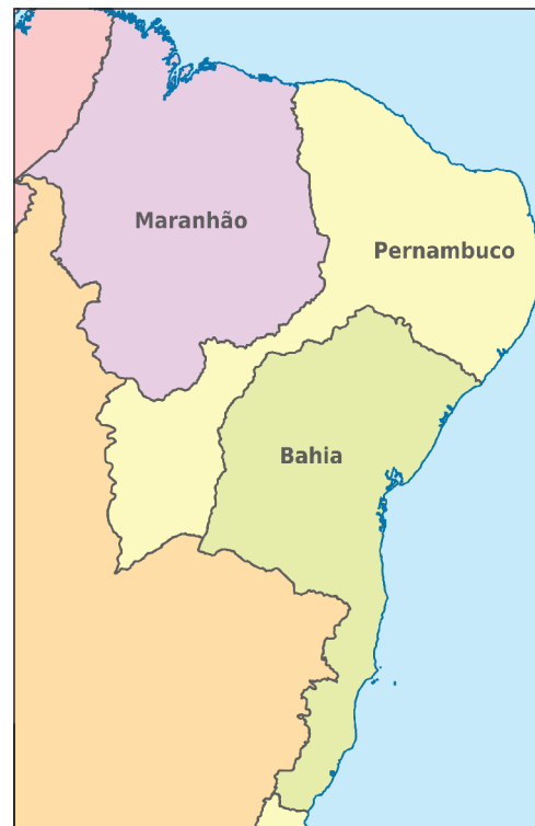
1645-1850 Território de Pernambuco

Divisão do Brasil entre donatários portugueses para colonização e exploração.