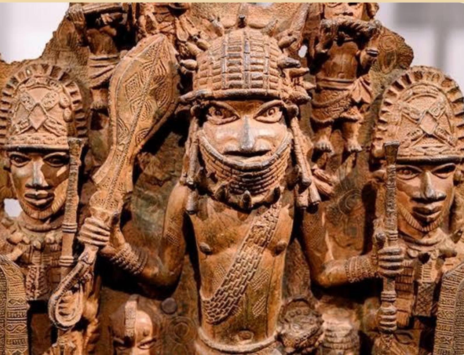
Benin - bronze 1500