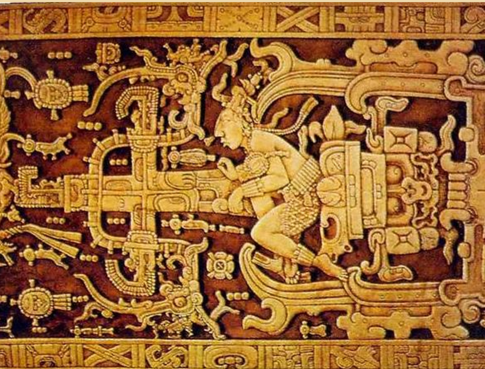
Tampa do sarcófago do soberano de Palenque: "Pacal Votan", o guerreiro sagrado, Templo das Inscrições, Chiapas, México

Termo grego "Historie" (conhecimento através da investigação). (Períodos e Características)